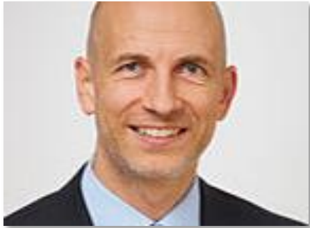
Prof. Dr. Martin Kocher