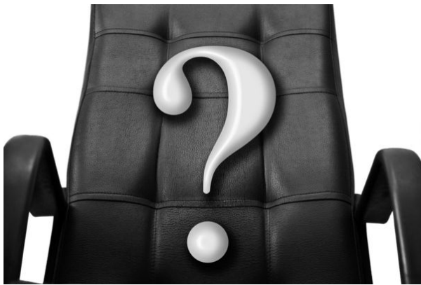
Wer nimmt auf dem Chefsessel Platz?